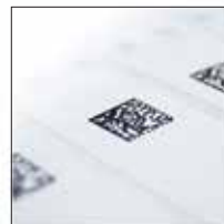
Códigos de Barra HD